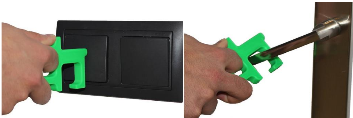
Imagen 7.- Útil de apertura y cierre de puertas y ventanas y pulsador de botones e interruptores.

En sexto lugar, las personas que desarrollan su actividad en la Escuela dispondrán de un útil de apertura y cierre de puertas y ventanas, así como pulsador de botones e interruptores usados en el día a día (Imagen 7). Para el correcto uso del útil, este dispone tres agujeros para poder emplearlo bien colgado al cuello o de la cintura. El diseño ergonómico facilita su manejo con solo tres dedos, con una zona de agarre totalmente separada de la zona de contacto. Es importante desinfectarlo cada cierto tiempo empleando gel hidroalcohólico preferiblemente, o en su defecto lejía o jabón.