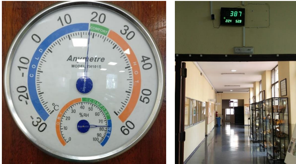
Imagen 6.- Sensores de temperatura y humedad. Medidor de dióxido de carbono.

En las aulas, se han implementado sensores de temperatura y humedad que permiten llevar a cabo un control de dichos parámetros ambientales. También en el hall de la escuela, además de controlar estas variables se efectúa un control de dióxido de carbono, gracias al medidor instalado que adicionalmente también mide temperatura y humedad ambiental (Imagen 6).