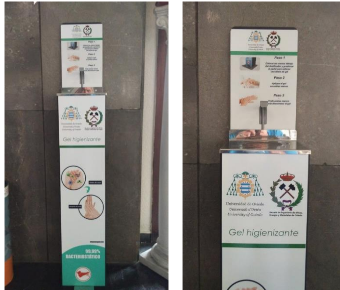
Imagen 3.- Dispensador de gel hidroalcohólico de pedal.

En tercer lugar, existe un dispensador de gel hidroalcohólico de pedal con una capacidad de 5 litros en la entrada justo al lado del medidor de temperatura corporal facial (Imagen 3). Mediante el empleo de este tipo de geles, se disminuye en gran medida la transmisión del virus por contacto.