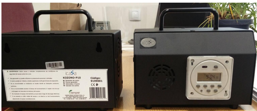
Figura 5.- Ozonificadores programables.

Por lo tanto, el empleo de ozono, para la desinfección de aire y superficies resulta mucho más recomendable que el uso de otros desinfectantes, aparte de por su eficacia, por su rápida descomposición, que no deja residuos peligrosos. Ello permite trabajar siempre en las mejores condiciones.