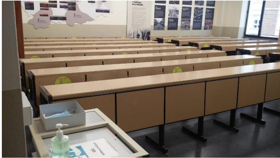
Imagen 4.- Aula con pegatinas indicativas en los asientos a ocupar por parte de los estudiantes, gel hidroalcohólico y mascarillas higiénicas.

Está previsto que, a la hora de impartir las clases, se mantengan las puertas y ventanas de las aulas abiertas en la medida de lo posible. Ello contribuirá a incrementar la tasa y frecuencia de renovación del aire interior, y de esta manera a disminuir las posibilidades de transmisión en caso de que una persona esté infectada. El aire es un fluido en constante movimiento lo que dificulta el contagio en el exterior, donde además el ingente volumen de aire por individuo disipa la concentración de carga viral. En caso de que no fuese posible mantener puertas y ventanas abiertas, entonces en los descansos entre clases se procederá a la ventilación de los diferentes espacios docentes.